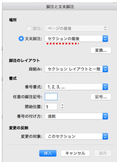
図 3 文末脚注の設定画面

Word で注を挿入する際は、通常は既定となっている「脚注」の形ではなく、「文末脚注」を選んで、「セクションの最後」に挿入する形にすること（図 3） 7 。