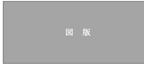
図1 図版のレイアウト